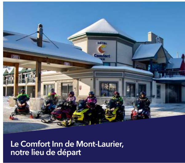
Le Comfort Inn de Mont-Laurier, notre lieu de départ

Ces facteurs ont rendu exceptionnelle notre longue fin de semaine de randonnée à sacoches pour couples. Pendant trois jours et demi et 820 kilomètres, nous avons fait de la motoneige principalement au nord de Mont-Laurier (voir l'itinéraire). Ceux qui veulent faire plus de jours de randonnée peuvent ajouter plusieurs autres boucles, en roulant vers le sud à partir du Comfort Inn Mont-Laurier vers des destinations comme Duhamel, Maniwaki ou Sainte-Agathe-des-Monts. Il y a certainement au moins une semaine de bonne randonnée dans toute la région des Laurentides, que ce soit en randonnée d'une journée ou en randonnée de plusieurs jours à partir de cet hôtel très accueillant pour les motoneigistes.